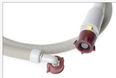
105 028 Aquastopp

Zur Absicherung Ihrer Vollentsalzungsanlage oder RDGs