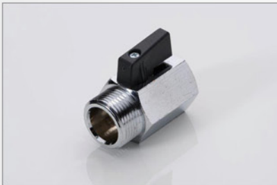
105 049 Absperrventil