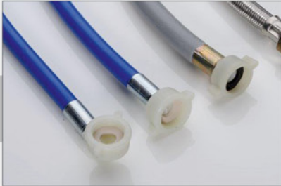
105 047 Schlauchset Gummi

Leistung: 300 (l/h) Außenmaße (d × h): 239 mm × 490 mm ca. 17 kg