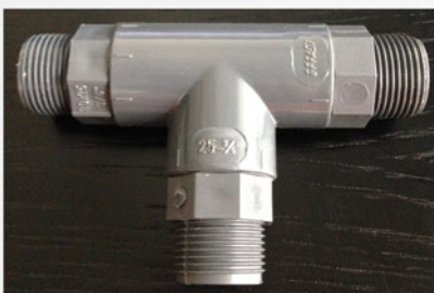
105 055 T-Stück Zum Anschluss von 2 Thermodesinfektoren oder 1 Thermodesinfektor und 1 Autoklaven