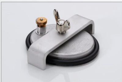
105 053 Edelstahl- verschlussdeckel