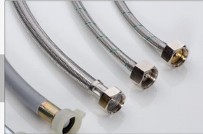
105 048 Schlauchset Edelstahl