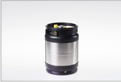
105 043 Kartusche 445