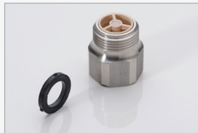
105 054 Rückschlagventil