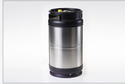
105 044 Kartusche 490

Leistung: 300 (l/h) Außenmaße (d × h): 239 mm × 445 mm ca. 15 kg