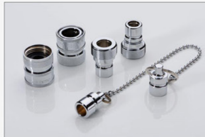
105 052 Schnellkupplung (Set)