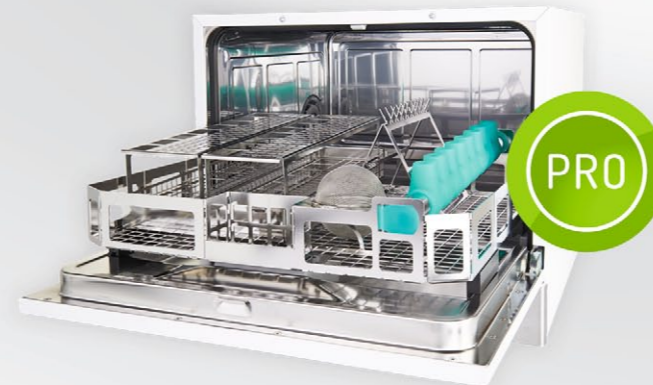
Thermodesinfektor HD 450 PRO

Thermodesinfektor HD 450 Injection PRO (mit Hohlkörperaufbereitung, speziell für die Fachrichtungen Zahnheilkunde, Hals-Nasen-Ohrenheilkunde und Chirurgie.)