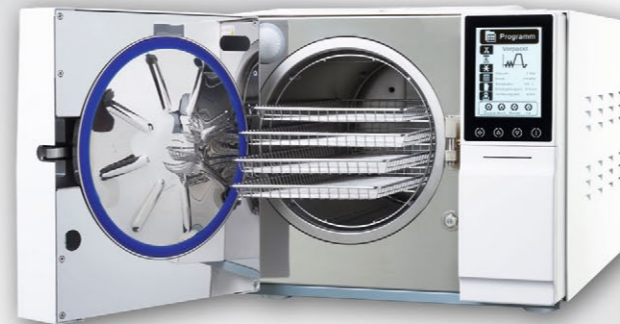
B-Klasse Autoklav TT+ 23

Die kompakte Bauweise spart wertvollen Platz und bietet wie kein anderes Gerät die optimale Lagerung der Verpackungsfolien.